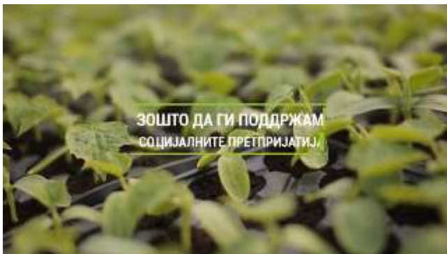
Поддршка за развој на локални социјални претпријатија

Нови иницијативи за социјално претприемништво беа презентирани пред бизнис заедницата во интерактивниот дел од овој настан – Конектирај се!, каде има потенцијална можност дел од предложените идеи да се поттикнат и да резултираат во успешни примери на социјално претприемништво во нашата земја. Наменет специјално за поврзување на граѓанскиот сектор со бизнис заедницата, Конектирај се! овозможи да се зголеми поддршката за социјално претприемништво од страна на компаниите преку градење партнерства (вмрежување) со невладините организации.